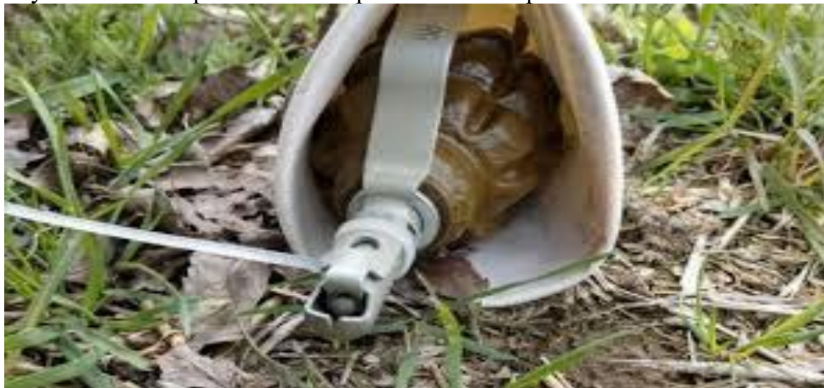
120 мм минометная мина

Способ установки оборонительной гранаты Ф-1 на растяжке в пластиковом стакане