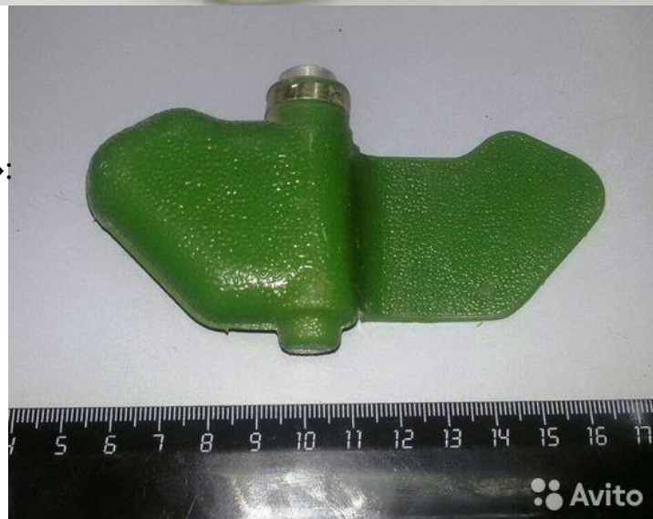
Размеры «Мины – ЛЕПЕСТКА»: