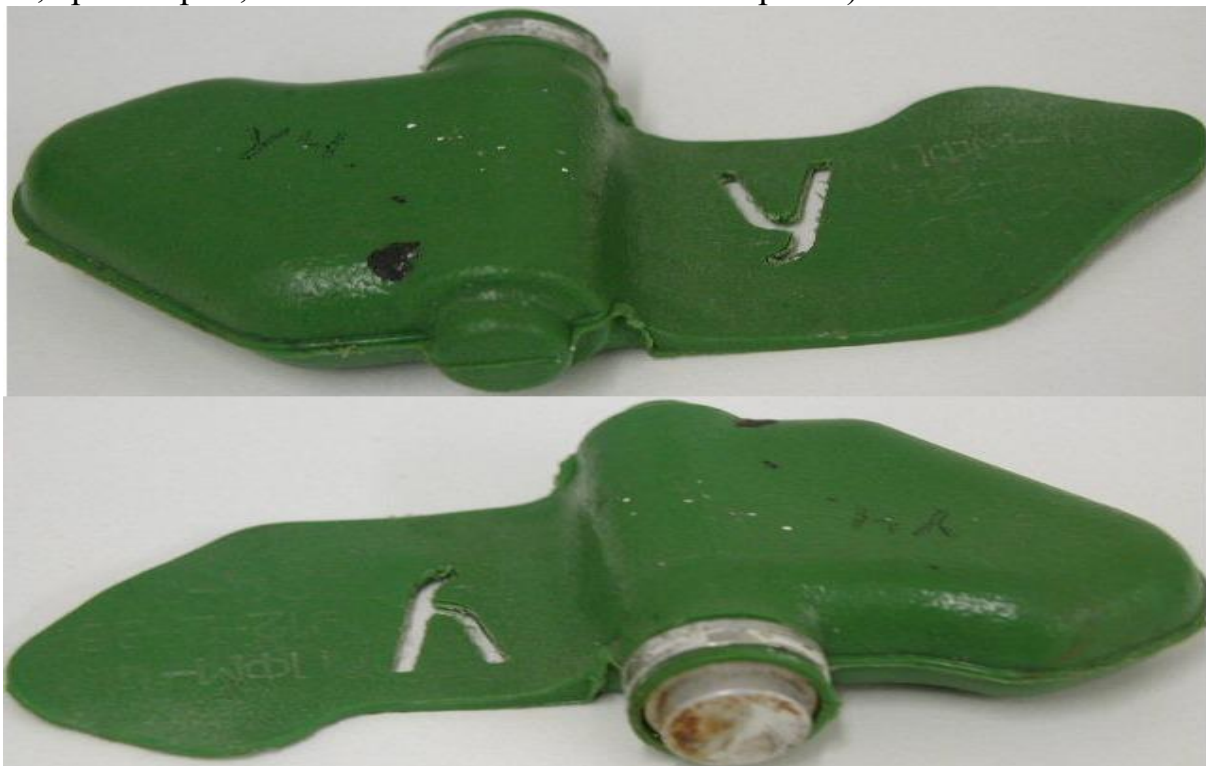
Внешний вид «Мины – ЛЕПЕСТКА»:

Масса мины 80 грамм, размеры – 12 х 6 сантиметров, чувствительность мины лежит в пределах 5-25 кг, что вполне достаточно для срабатывания от веса маленького ребенка.