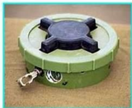
Рис.1 Общий вид мины ПМН-2